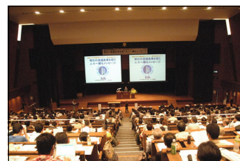
「流通産業ライブラリー」設立記念セミナー (2009年5月23日(土))

例えば「ペガサス文庫」では、流通・サービス業界の成長・激動期を含む45年におよぶ業界分析記録である『チェーンストアのための経営情報』を全冊そろって一般公開しているのは、日本では同ライブラリーだけです。高度経済成長の波に乗り急成長した流通・消費財産業の歴史的発展の裏付けとなる図書資料のコレクションを、ぜひ、ご活用ください。