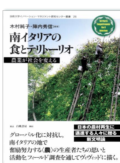
『南イタリアの食とテリトリーオ—農業が社会を変える—』（2024，白桃書房）

■ヴェネツィア大学客員教授(2012~2014年)。専門はテリトリーオ，地理的表示(GI)保護制度，地域活性化。著書：木村純子・陣内秀信編著『イタリアのテリトリーオ戦略：甦る都市と農村の交流』（2022，白桃書房），木村純子・陣内秀信編著『南イタリアの食とテリトリーオ：農業が社会を変える』（2024，白桃書房），Vandecandelaere他編『Worldwide Perspectives on Geographical Indications』（2025，Springer），木村純子・前田浩史編著『一杯の牛乳がつなぐもの：学校給食から考える子どもと地域の未来』（近刊，女子栄養大学出版部）。