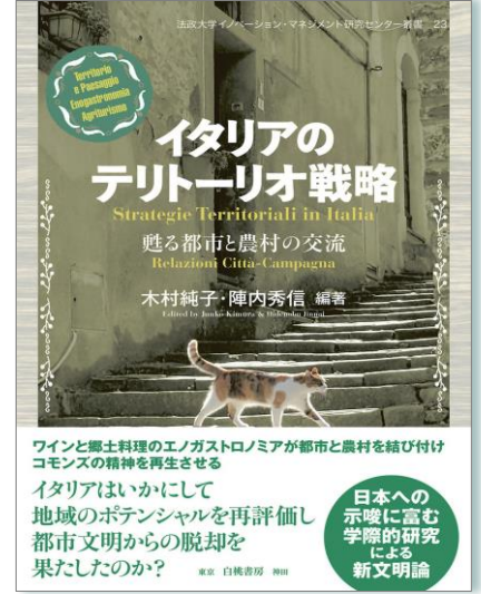
『イタリアのテリトリーオ戦略—甦る都市と農村の交流—』（2022，白桃書房）